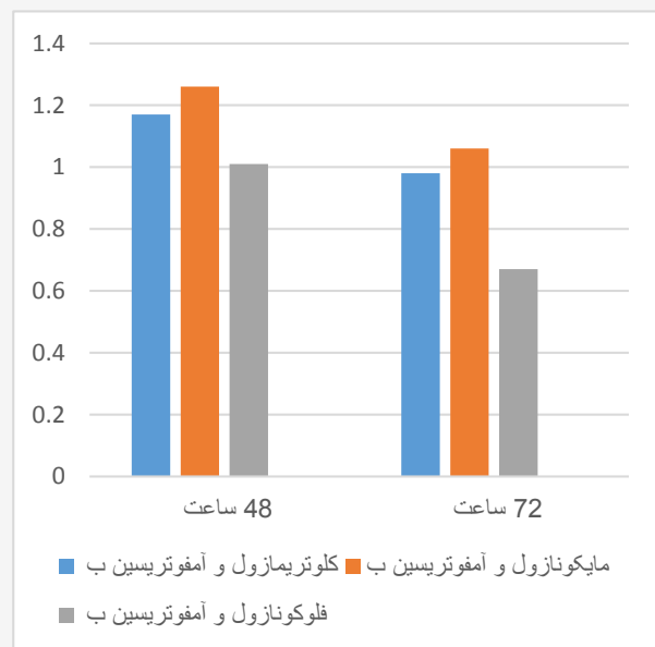
نمودار ۲: مقایسه FIC ترکیبات داروهای متداول بعد از ۴۸ و ۷۲ ساعت

در بررسی نتایج MIC50 و MIC90 داروهای متداول، محدوده MIC50 برای کلوتریمازول ۲-۰/۵ میکروگرم بر میلی‌لیتر و MIC90 آن ۳۲-۱ میکروگرم بر میلی‌لیتر بدست آمد. MIC5 داروی مایکونازول ۲-۰/۵ میکروگرم بر میلی‌لیتر و