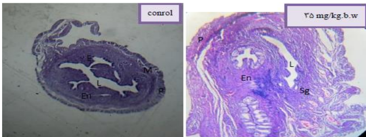
شکل ۱- تصویر میکروگراف برش عرضی بافت رحم گروه کنترل و تجربی با دوز ۳۵ mg/kg.b.w (بزرگ‌نمایی ۴۰×) P= پریمتر =M=میومتر =En=آندومتر =Sg= غدد ترشچی =L=لومن =E= اپی تلیوم