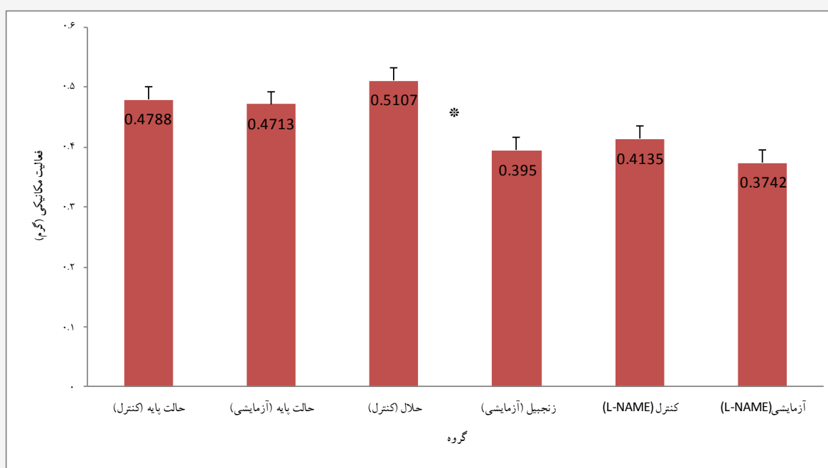
نمودار ۳- شمای کلی از برهم کنش عصاره هیدروالکلی زنجبیل با سیستم نیتریک اکسید برحسب میانگین و انحراف استاندارد میانگین (Mean \pm SEM) نمودار ۳- شمای کلی از برهم کنش عصاره هیدروالکلی زنجبیل با سیستم نیتریک اکسید برحسب میانگین و انحراف استاندارد میانگین (Mean \pm SEM) * تفاوت معنی دار با گروه کنترل

همانگونه که در بخش نتایج اشاره شد تجویز عصاره هیدروالکلی زنجبیل پس از مدت ۱۵ دقیقه منجر به شل شدن