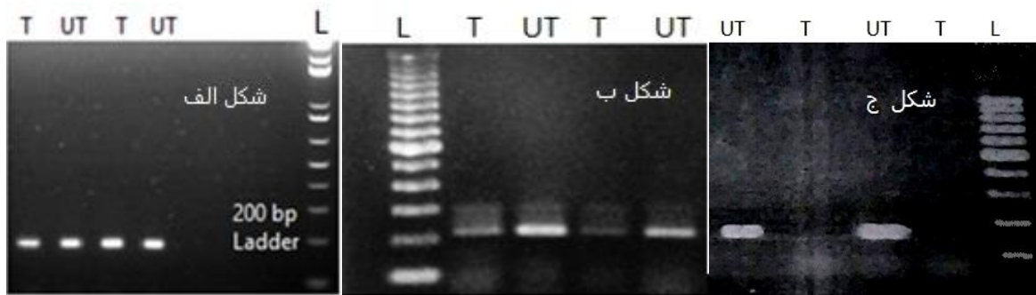
شکل ۱- تجزیه و تحلیل نتایج الکتروفورز محصولات RE-PCR ژن ویمنتین. T: بیمار شده، UT: بیمار نشده، L: Ladder

شکل الف گروه سالم: در نمونه‌های تیمار شده و تیمار نشده با آنزیم، به علت متیله بودن جایگاه مورد نظر، برش آنزیمی صورت نگرفته و همه نمونه‌ها به طور کامل تکثیر شده‌اند. شکل ب گروه بیمار: در نمونه‌های تیمار شده به علت هایپومتیله بودن برش آنزیمی اتفاق افتاده و نمونه‌ها به طور نسبی تکثیر شده‌اند ولی در نمونه‌های تیمار نشده تکثیر به طور صحیح و کامل انجام شده است. شکل ج گروه بیمار: در نمونه‌های تیمار شده اصلاً تکثیر انجام نشده که حاکی از برش آنزیمی و هایپومتیلاسیون کامل جایگاه مورد بررسی است. نتیجه تکثیر در باند ۲۰۰ bp باید واقع شود.