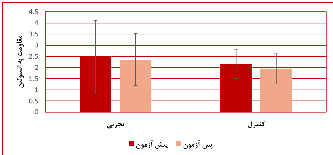
نمودار ۲- مقایسه میانگین ( \pm انحراف معیار) مقاومت به انسولین دو گروه پیلاتس و کنترل