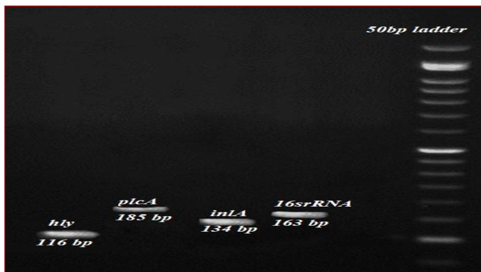
شکل ۱- الکتروفورز محصولات ژن‌های hly، plcA، inlA و 16SrRNA باکتری لیستریا مونوسیتوژنز در حضور مارکر 50bp

برای تأیید حضور ژن‌های مورد مطالعه در باکتری لیستریا مونوسیتوژنز تکنیک واکنش زنجیره‌ای پلیمرز انجام شد، سویه‌ی مورد مطالعه واجد تمام ژن‌های مورد بررسی، یعنی hly، plc و inlA بود (شکل ۱).