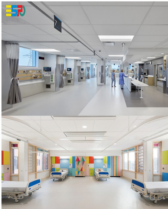
تصویر ۲- بالا، ترکیب رنگ های استفاده شده در سطوح داخلی اورژانس- تصویر پایین، ترکیب رنگ های استفاده شده در بخش ریکاوری.